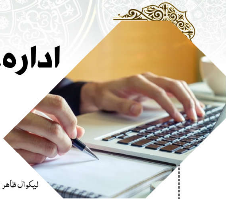
لیکوال ظاهر "منیب"

اړخ نلري، چې دا دهیوادونو سترمنافقت په ډاگه کوي. مونږ پوهیږو چې نړۍ دیولې مقرراتو له مخې اداره کیږي چې دامقررات په یوشمېر هیوادونوکې لږ، اوپه یو شمېر هیوادونوکې ډېر، اوپه یوشمېر هیوادونو کې، ورته هیڅ ارزښت نه ورکول کیږي. دولت څلور متشکله عناصر: قلمرو، نفوس، حکومت، اوحاکمیت لري، چې په لرلویې دولت خپل مشروعیت لاسته راوړي، پدې مانا چې که په څلورو متشکله عناصرو کې یوهم نه وي، دولت خپل مشروعیت له لاسه ورکوي، یعنی مونږ ورته یو مشروع دولت نشو ویلای. همدارنگه حکومت هم پنځه حقوقي شرایط لري، دحکومت بڼه دومره داهمیت وړ نه ده، خو که یو حکومت خپل حقوقي شرایط، لکه، دامنیت او ثبات رامنځته کول، دقانون اومقرراتو پلي کول، له خپل قلمرو (خاورې) څخه دفاع، له استقلالیت څخه دفاع، اودملت داکثریت خلکو خوښه (رضایت) ونلري، له حقوقي نگاه څخه هیڅ حقوق پوه ورته مشروع حکومت نشي. ویلای، همدارنگه، که ددولت دمتشکله عناصرو له حیثه اوسنی سهامی شرکت وارزوی، یواځې ۱۵٪ سلنه قلمرو په مستقیم او غیرمستقیم ډول تر خپلې فاسدې واکمنۍ لاندې لري، اوپه طبعي ډول همدافیسدي نفوس هم ددوی د حاکمیت ترپوښښ لاندې ژوند کوی